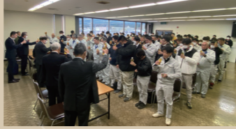
▲2023年 新年会(仕事始め式)